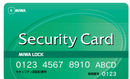
セキュリティカード (製品に同梱)