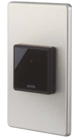
RDNT-B07A (防雨形) 新製品