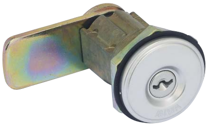
写真はPCL02B型 (シリンダーカバーなし/カムストレートタイプ)