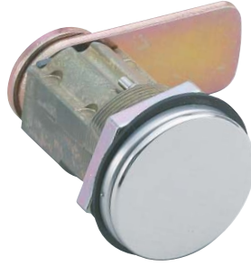
写真はPCL01B型 (シリンダーカバーあり/カムストレートタイプ)