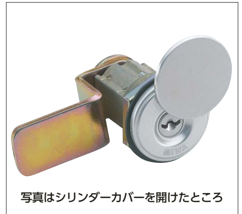
写真はシリンダーカバーを開けたところ