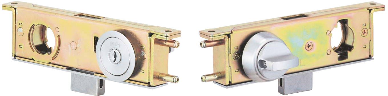
写真はU9TRU-1型 (ST) (左勝手を示す)