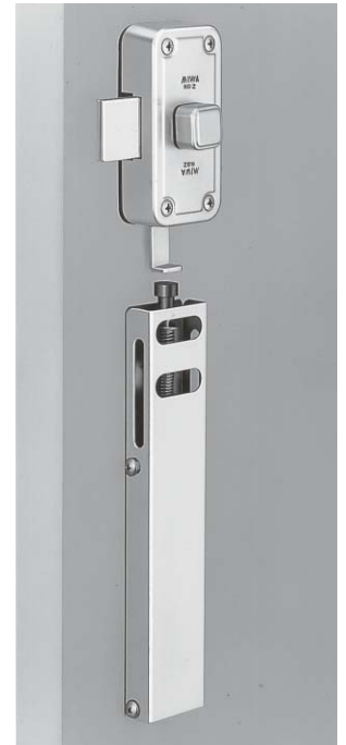
写真はU9KW-5型 (外開き右勝手を示す)