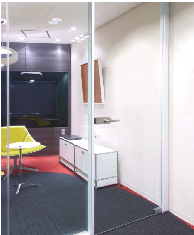
フレストラ株式会社様ショールームにて撮影