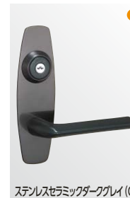
ステンレスセラミックダークグレイ (CD)