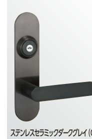
ステンレスセラミックダークグレイ (CD)