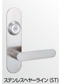
ステンレスヘアライン (ST)