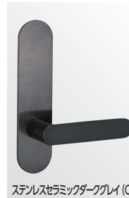
ステンレスセラミックダークグレイ (CD)