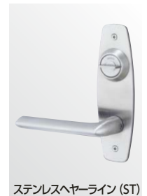
ステンレスヘアライン (ST)