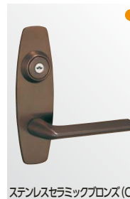
ステンレスセラミックブロンズ (CB)