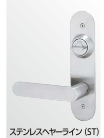
ステンレスヘアライン (ST)