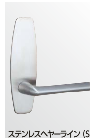
ステンレスヘアライン (ST)