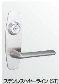
ステンレスヘアライン (ST)

U9LA52-1型 (R=ELA16) : ST, SB, CB, CD仕上、U9LA74-1型 (R=ELA16) : BS, YB仕上