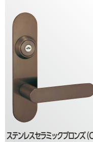
ステンレスセラミックブロンズ (CB)