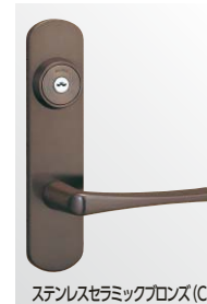
ステンレスセラミック gloss (CB)