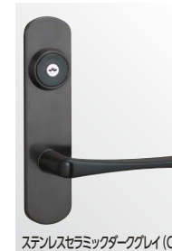
ステンレスセラミックダークグレイ (CD)