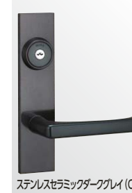
ステンレスセラミックダークグレイ (CD)