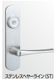
ステンレスヘアライン (ST)