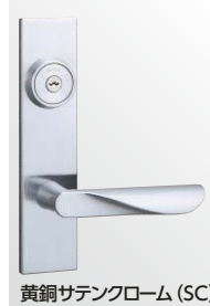
黄銅サテンクローム (SC)