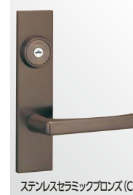
ステンレスセラミック gloss (CB)