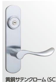
黄銅サテンクローム (SC)