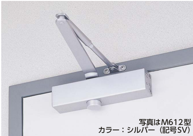
写真はM612型 カラー：シルバー（記号SV）