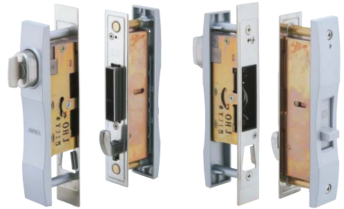
写真はSL99-5型 (SV) 新製品