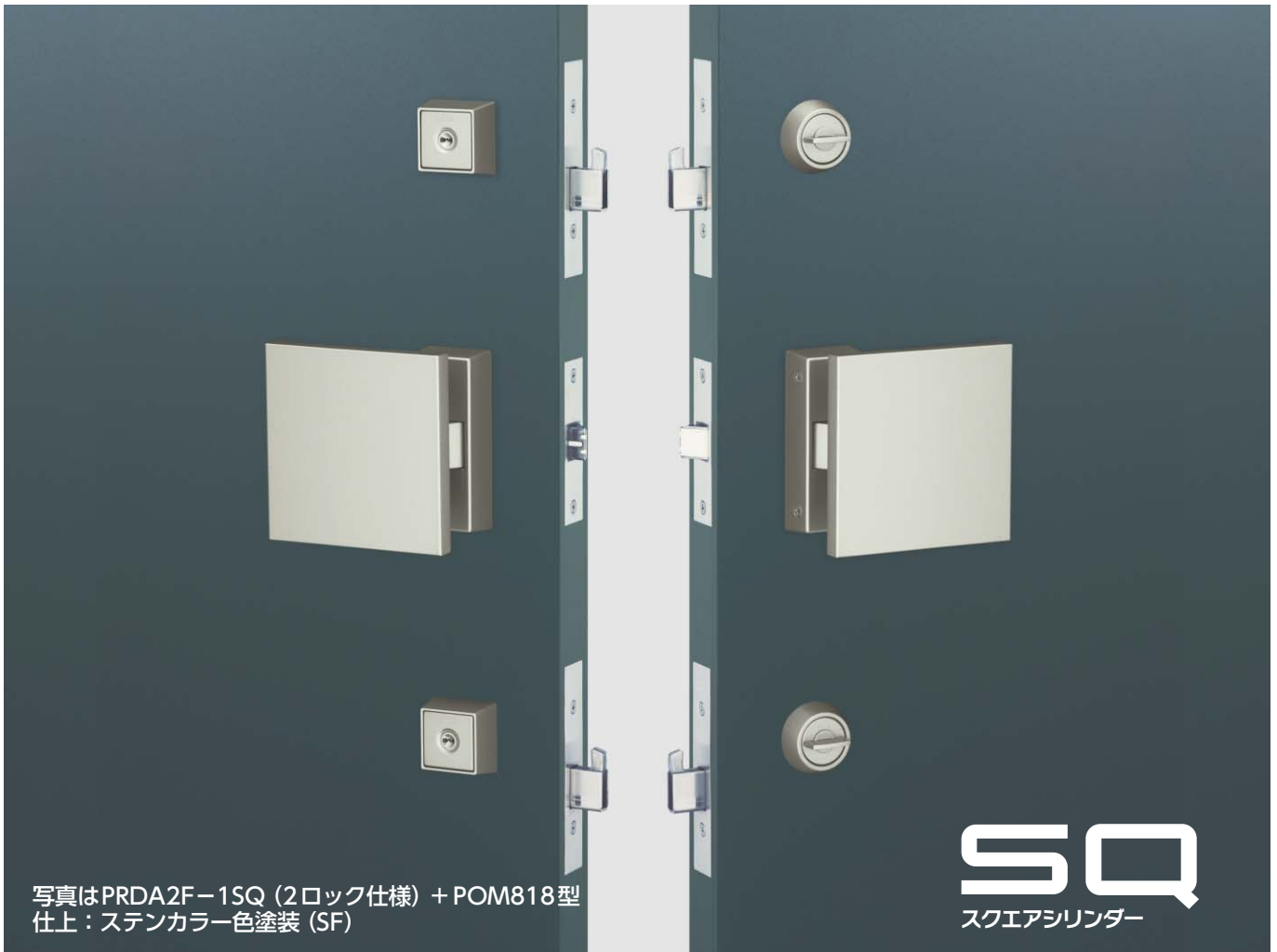
写真はPRDA2F-1SQ (2ロック仕様) + POM818型 仕上:ステンカラー色塗装 (SF)