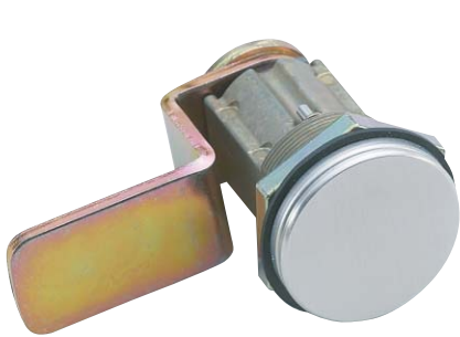
写真はPCL01A型 (シリンダーカバーあり/カム曲げタイプ)