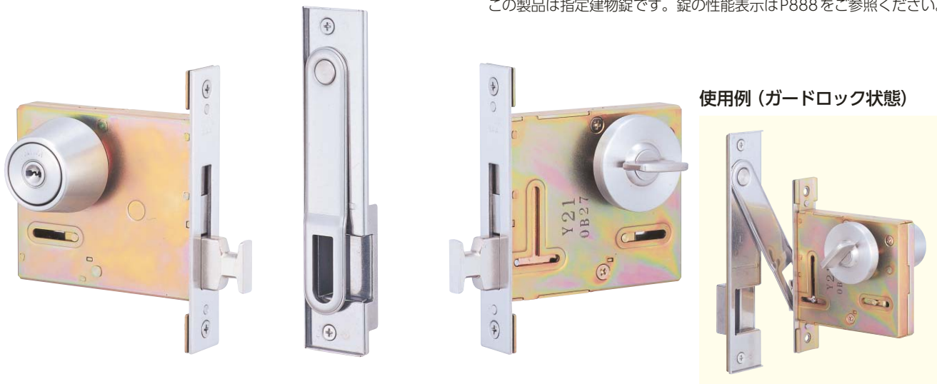
写真はPRGAA-1型 (左勝手を示す)