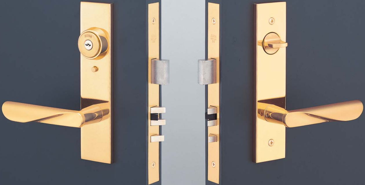
写真はU9LHHF6811型(YB) (内開き右勝手を示す)