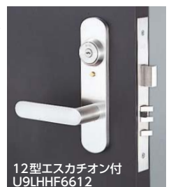
12型エスカチオン付 U9LHHF6612