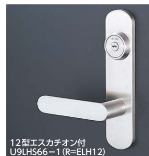
12型エスカチオン付 U9LHS66-1 (R=ELH12)