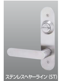
ステンレスヘアライン (ST)