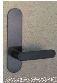
ステンレスセラミックダークグレイ (CD)