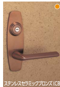
ステンレスセラミックブロンズ (CB)