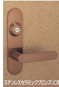
ステンレスセラミックブロンズ (CB)