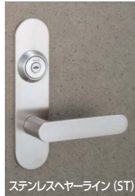
ステンレスヘアライン (ST)