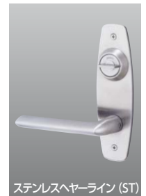
ステンレスヘアライン (ST)