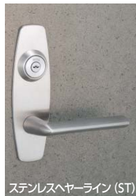
ステンレスヘアライン (ST)

U9LA52-1型 (R=ELA16) : ST, SB, CB, CD仕上、U9LA74-1型 (R=ELA16) : BS, YB仕上