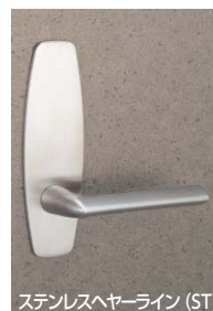
ステンレスヘアライン (ST)