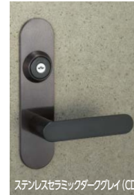
ステンレスセラミックダークグレイ (CD)