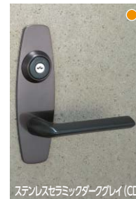
ステンレスセラミックダークグレイ (CD)