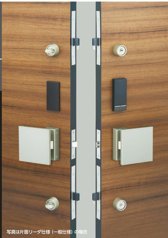
写真は片面リーダ仕様(一般仕様)の場合

キーをカバン等から取り出す必要がないので、キーの存在を意識することがありません。