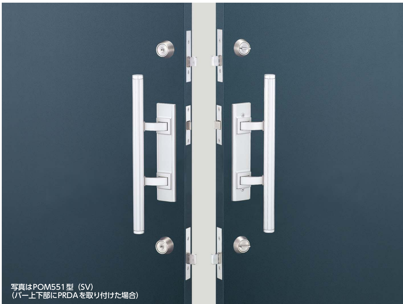
写真はPOM551型 (SV) (バー上下部にPRDAを取り付けた場合)

■ バータイプのプッシュプル錠です。 シンプルでスリムなデザインのバーハンドルです。