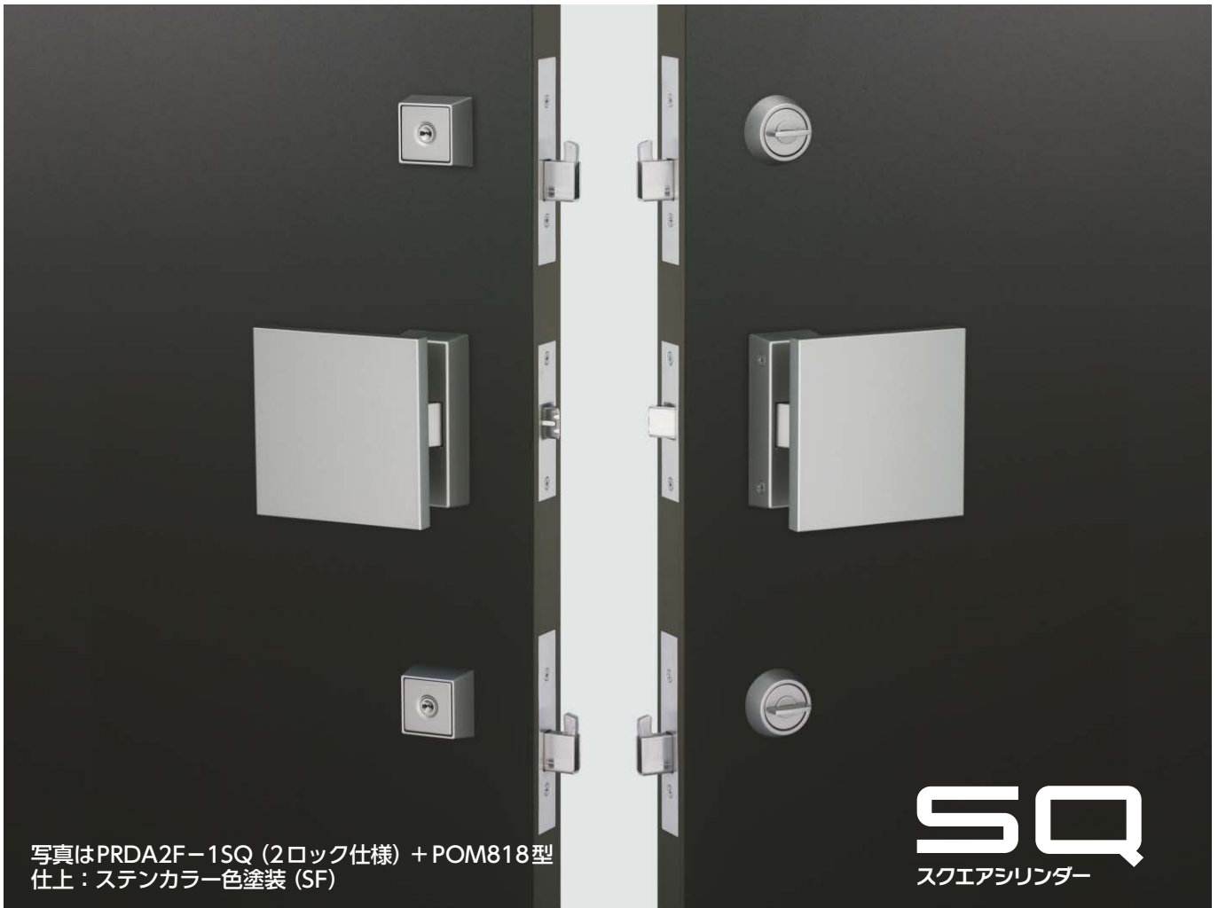
写真はPRDA2F-1SQ (2ロック仕様) + POM818型 仕上:ステンカラー色塗装 (SF)