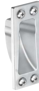
片開き用ストライク SKB型