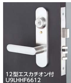
12型エスカチオン付 U9LHHF6612