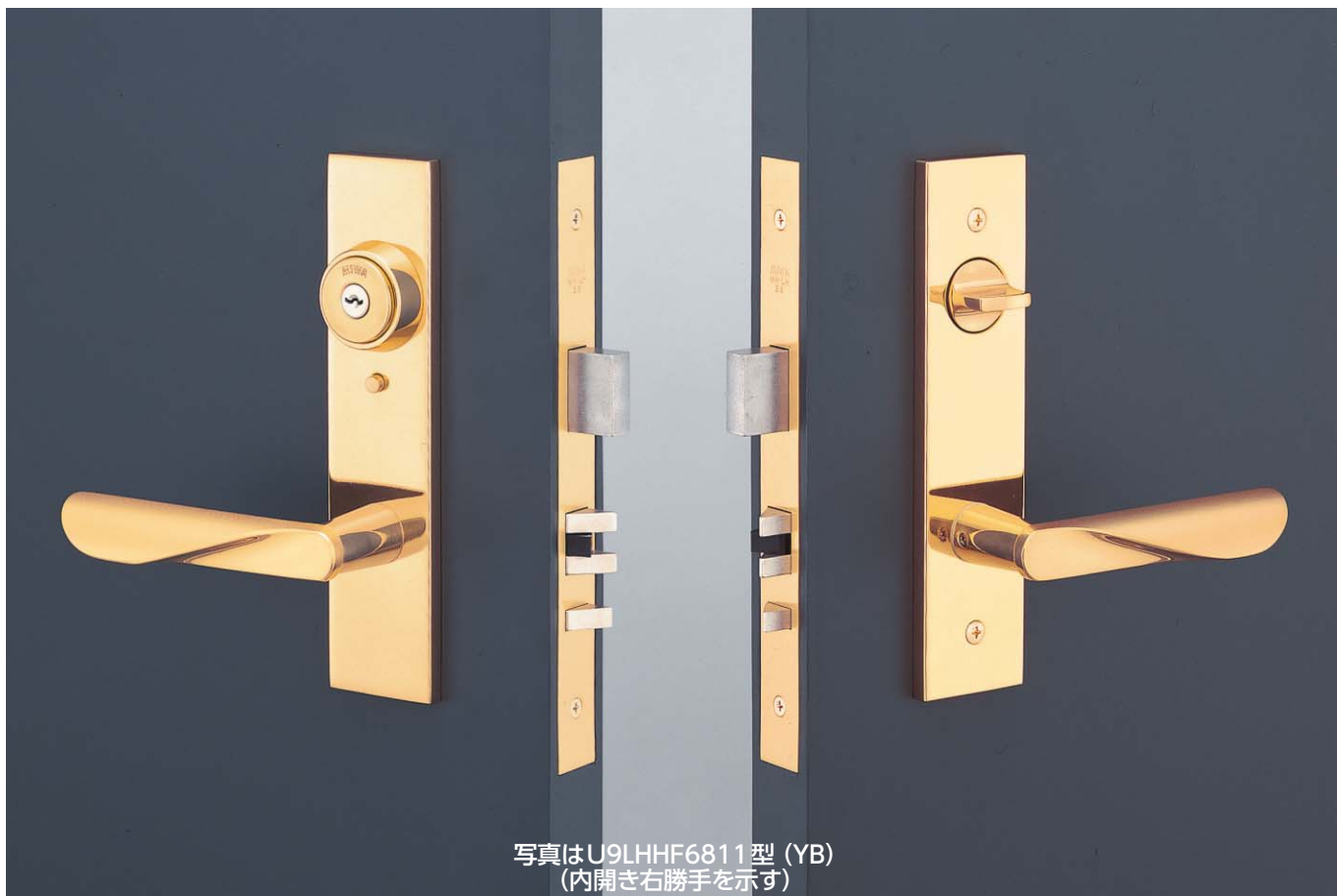
写真はU9LHHF6811型(YB) (内開き右勝手を示す)