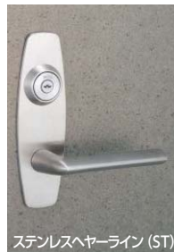
ステンレスヘアライン (ST)

U9LA52-1型 (R=ELA16) : ST, SB, CB, CD仕上、U9LA74-1型 (R=ELA16) : BS, YB仕上