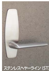
ステンレスヘアライン (ST)