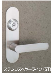
ステンレスヘアライン (ST)