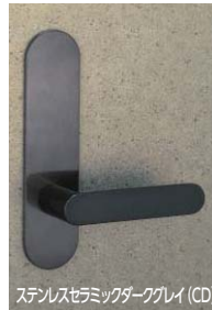
ステンレスセラミックダークグレイ (CD)