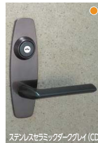
ステンレスセラミックダークグレイ (CD)