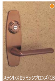
ステンレスセラミックブロンズ (CB)