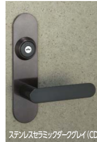
ステンレスセラミックダークグレイ (CD)