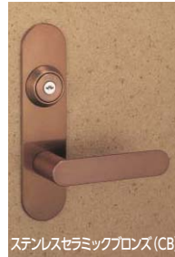
ステンレスセラミックブロンズ (CB)