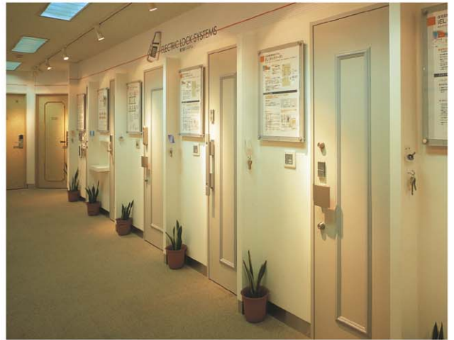
デザインコーナー