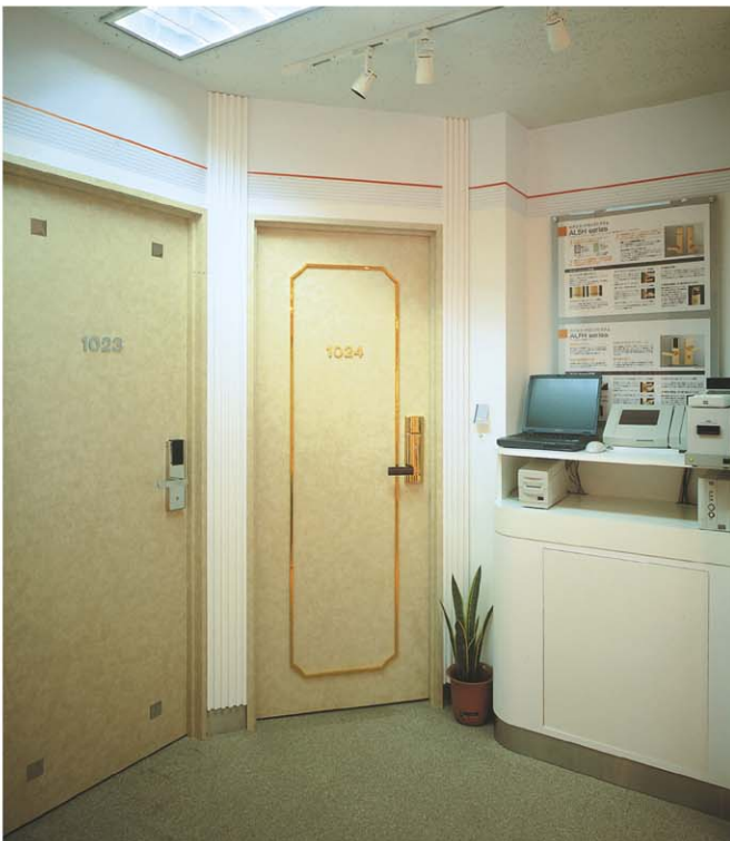
ホテルカードロックシステムコーナー

大阪支店内と名古屋支店内にもショールームがございます。詳細は各支店へお問い合わせください。