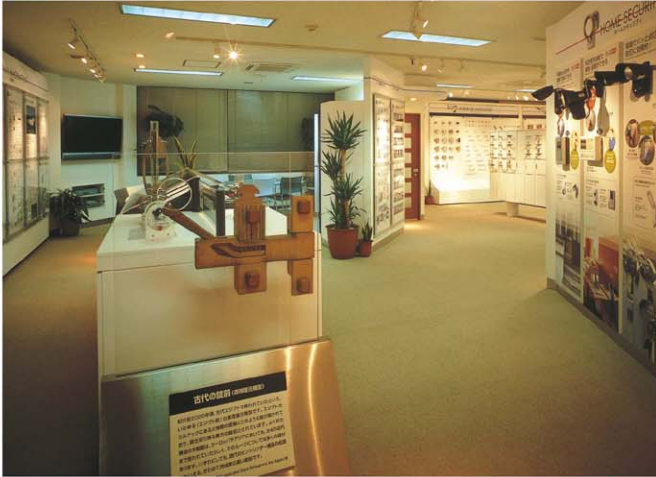
ホテルカードロックシステムコーナー