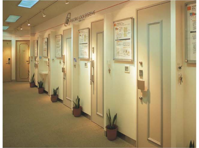
デザインコーナー