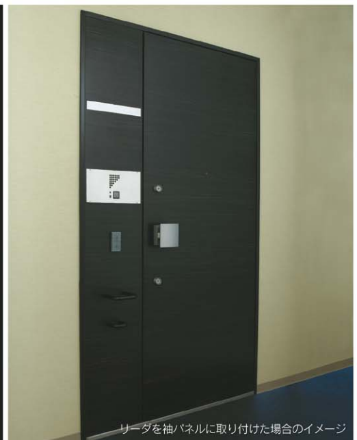
リーダを袖パネルに取り付けた場合のイメージ

制御回路を電気錠本体に組み込んだマンション用電気錠です。ますます高機能化、高防犯化が求められる住宅玄関に最新技術でお応えします。