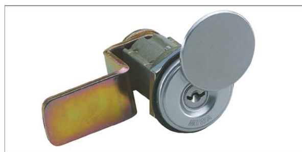
写真はシリンダーカバーを開けたところ

カムは曲げタイプ(Aタイプ)とストレートタイプ(Bタイプ)の2種類をご用意しています。