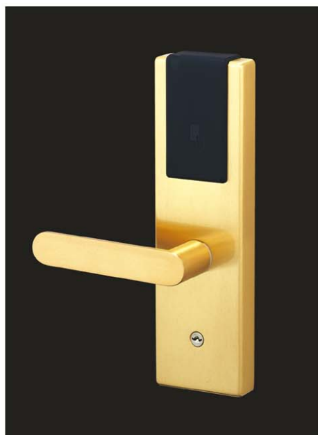
写真はU9ALFHJP66-1型 (BS) (内開き右勝手を示す)