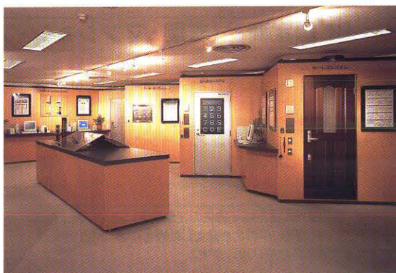
ビルセキュリティシステムコーナー