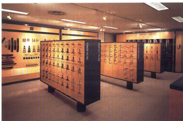
デザインコーナー