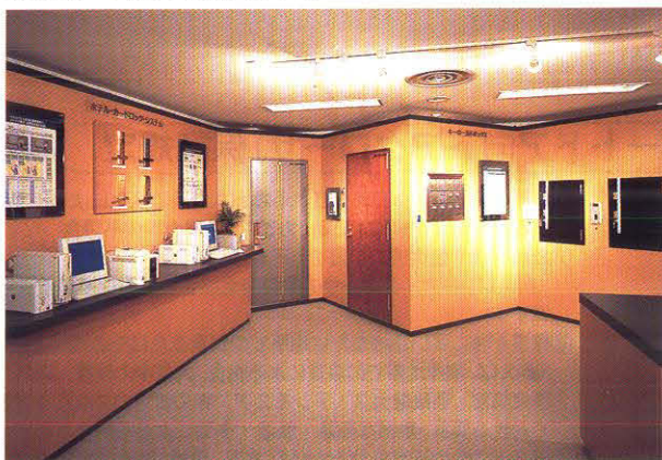
ホテルカードロックシステムコーナー