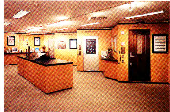
ビルセキュリティシステムコーナー