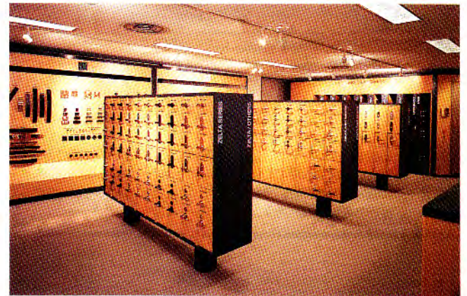
デザインコーナー