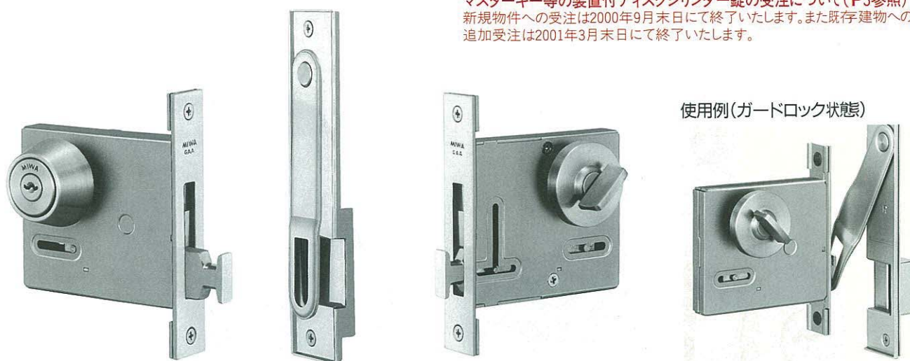
写真はU9GAA-1型 (左勝手を示す)

マスターキー等の装置付ディスクシリンダー錠の受注について(P3参照) 新規物件への受注は2000年9月末日にて終了いたします。また既存建物への追加受注は2001年3月末日にて終了いたします。