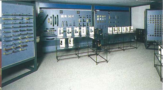
デザインコーナー