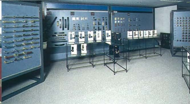
デザインコーナー