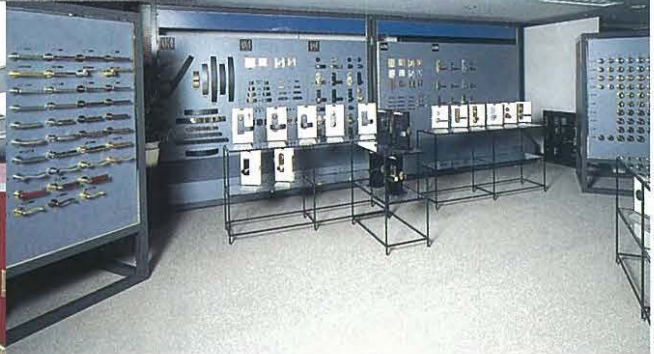
デザインコーナー