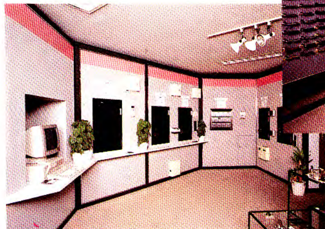
ビルセキュリティシステムコーナー