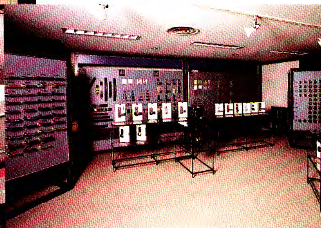
デザインコーナー