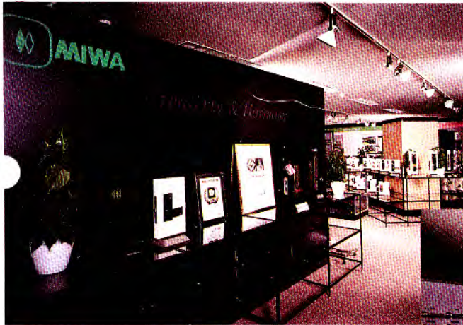
東京ショールーム

さらに、ホテル・カードロック・システム、総合安全システム、ホーム電気錠システムの実動モデルなども併設しておりますので、大いにご活用ください。