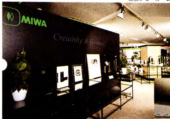
東京ショールーム

さらに、ホテル・カードロック・システム、総合安全システム、ホーム電気錠システムの実動モデルなども併設しておりますので、大いにご活用ください。