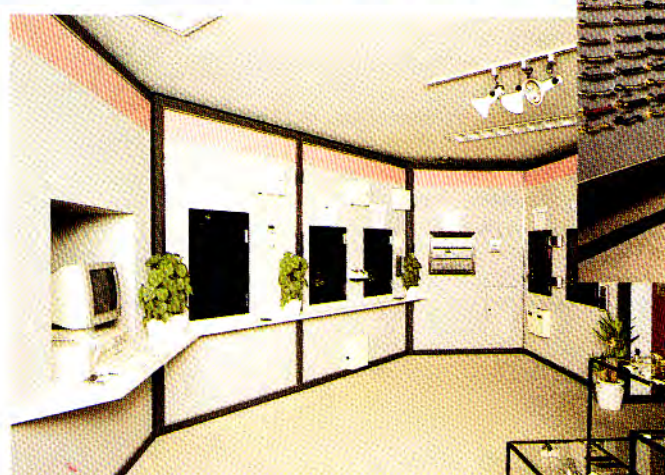
ビルセキュリティーシステムコーナー