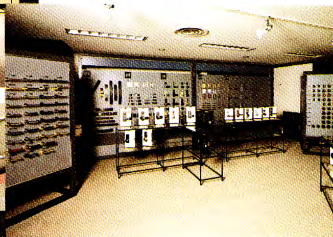
デザインコーナー