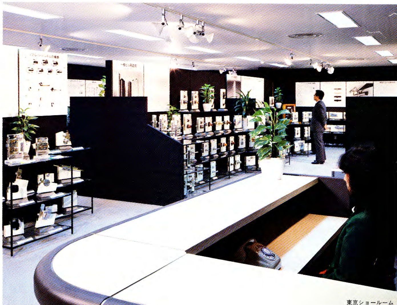
東京ショールーム